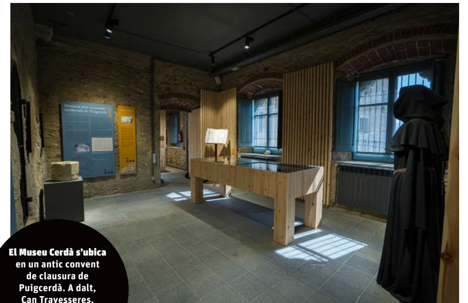
El Museu Cerdà s'ubica en un antic convent de clausura de Puigcerdà. A dalt, Can Travesseres, a Bellver de Cerdanya. A l'esquerra, la plaça nova de Ger.

Aquest any s'acabarà de museïtzar la part d'història de Puigcerdà i ja tenen museïtzada la part de la Casa Cerdana. Un altre objectiu és reivindicar el territori, les tradicions, la cultura i la història.